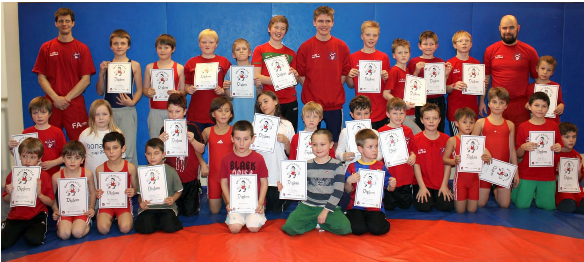
FÅR DIPLOM: Barna går opp til bryteknappen og får diplom. Her fra fjorårets bryteskole.